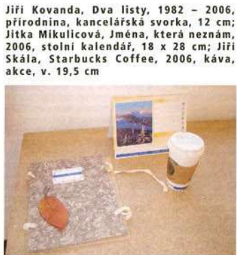
Jiří Kovanda, Dva listy , 1982 – 2006, přírodnina, kancelářská svorka, 12 cm; Jitka Mikulicová, Jména, která neznám , 2006, stolní kalendář, 18 x 28 cm; Jiří Skála, Starbucks Coffee , 2006, káva, akce, v. 19,5 cm