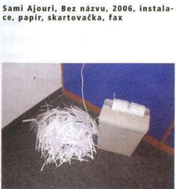
Sami Ajouri, Bez názvu , 2006, instalace, papír, skartovačka, fax