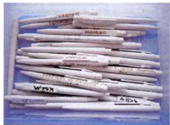
Štěpán Kleník, Propisky zadarmo , 2006, akce, propisky