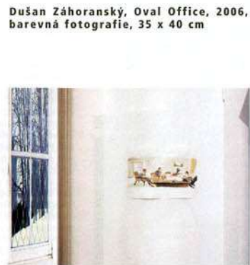
Dušan Záhoranský, Oval Office , 2006, barevná fotografie, 35 x 40 cm