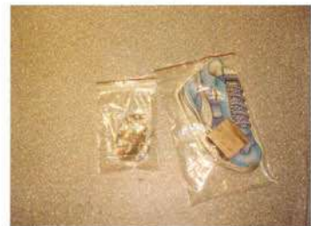
Marek Ther, Bez názvu , 2006, instalace, guma, papírový blok, razítko, igelitové pytlíky