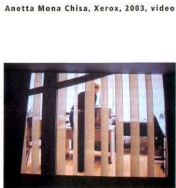
Anetta Mona Chisa, Xerox , 2003, video